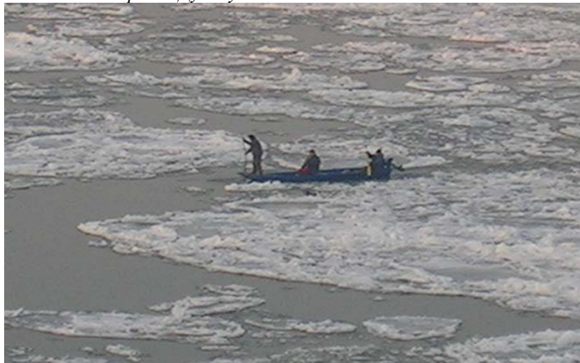
Слика 3 : Рибари на Дунаву

Уколико се има у виду све већи апел за развојем зелених видова туризма и потреба за његовим одрживим развојем, јасно је да Земун са посебном пажњом мора развијати туризам у овим зонама.