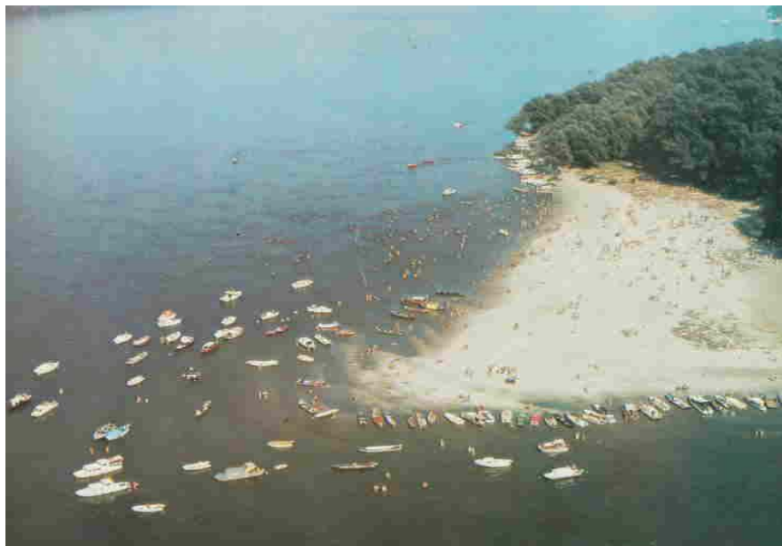
Слика 1. Узводни шици Великог ратног острва „Лидо“