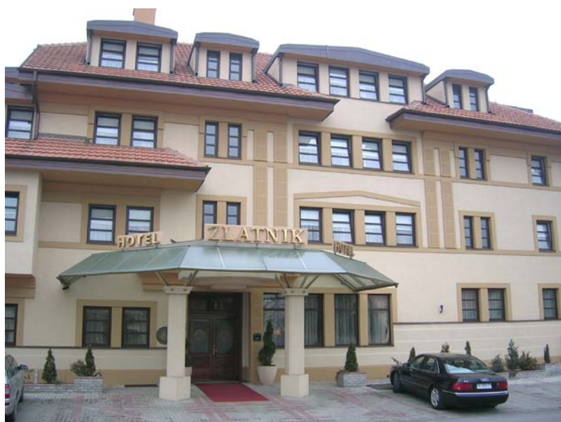
Слика 4 : Хотел Златник

Све напоменуто ће додатно обогатити смештајно угоститељску понуду, усмерену ка пословним турстима, учесницима конференција, као и осталим посетиоцима са високим приходима.