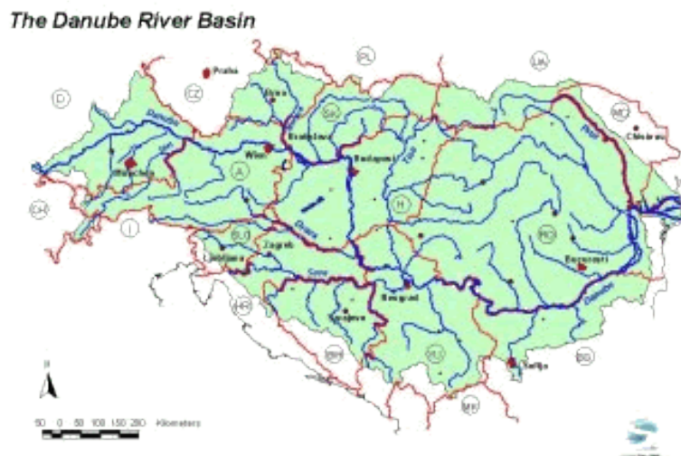
Карта 1. Сливно подручје Дунава

Ради побољшања пловидбених услова извршени су многобројни хидротехнички радови. Саграђени су бројни насипи, обало-утврде, уздужне и попречне водограђевине, а у сектору Ђердапа је прокопан канал, а потом изграђена и хидроцентрала. Тако да се из изложеног јасно уочава да на режим вода утицај имају како климатски, хидролошки тако и антропогени фактори .