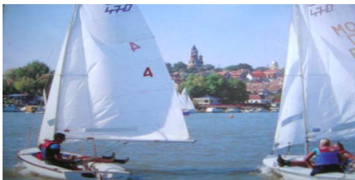
Слика 2: Једрилице на Дунаву

значајна за велики град као што је Београд. Прочисти ваздух, који је у овом велеграду све загађенији. По њеном престанку долази период киша.